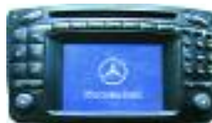
MB Comand 220