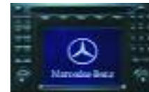
MB Comand 2.5 d